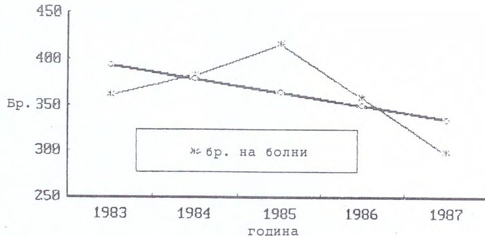
Графикон 1. Движење на бројот на лекуваните болни од малигни неоплазми на усната, во усната празнина и на фарингсот во болничките одделенија - линиски тренд, во Р. Македонија во периодот 1983-1987 г.