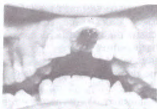
Слика 4. Повреда класа V (Beloica)