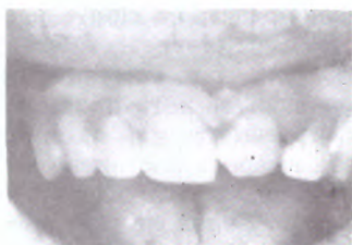
Слика 1. Повреда класа I (Beloica)

дали постојат мостови и други протетички помагала. Со прегледот особено треба да се назначи состојбата на забите околу избиеените или само расклатените заби. Потоа треба да се одбележи лежиштето на повредените заби (4), болната осетливост, степенот на расклатеноста и детално да се опишат повредените заби. Како при секое вештачење, и при вештачењето на повредите на забите потребно е да се утврдат квалитетот и бројот на повредите. Секоја од повредите треба поединечно да се квалификува, затоа што постои можност тие повреди да бидат нанесени на различни начини во динамиката на настанот, а од друга страна може да постојат повеќе повреди кои со своето збирно дејство претставуваат тешка телесна повреда. Затоа, сите најдени повреди се оценуваат поединечно, а во случај на повеќе повреди - треба да се квалификува нивното збирно дејство. Врз основа на повредите најдени во пределот на кожата на лицето и усните, слузокожата на усните и устата, како што се крвни подливи, слупувања, боцнатини, рани, исечени места и други, може