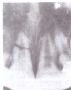
Слика 5. Повреда класа VI (Beloica)