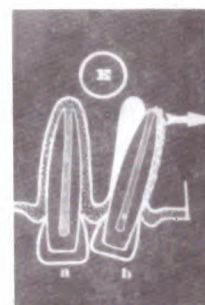
Слика 6. Повреда класа VII (Beloica)

Вештачење и квалификација на повредите на забите. При судско медицинските вештачења на повреди на забите како телесни повреди, прво што треба да се направи е да се изврши преглед на повредениот (2). При прегледот, вештакот е должен сите промени што ќе ги забележи на: кожата на лицето, усните, слузокожата на усните и устата, точно и прецизно да ги опише, детално да ја опише состојбата на забите, нивниот број, кои заби недостасуваат, кои заби се лекувани,