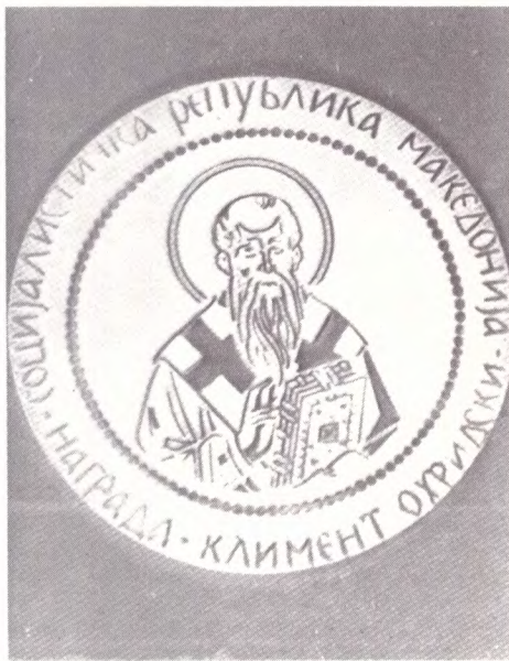
Награда „Климент Охридски“