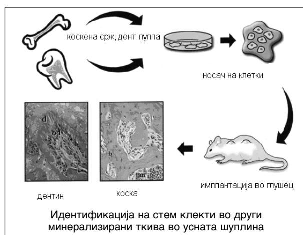
Слика 1. Отворени трансплант системи

Кооперативните интеракции клетка-клетка и клетка-матрикс во тек на коскениот развој се проучуваат на отворени трансплант системи (се карактеризираат со отсуство на бариера помеѓу донорот и клетките на домаќинот) каде BMSCs се поставуваат во дефинирани анатомски структури како на пример просторот под бубрежната капсула или субкутано на лабораториско животно. За да формираат коска на трансплантираните стем клетки потребна им е една организирана решетка („framework“) за која ќе се атхерираат и пролиферираат, во спротивно отсуствува појава на остеогенеза при трансплантација на стем клетки во вид на чиста клеточна маса без присуство на потпорна структура (24).